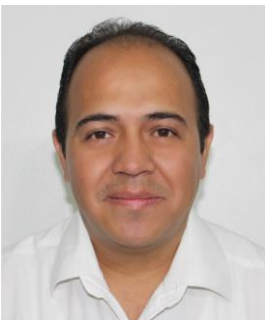
Ignacio Longares Flores Secretario General del Ayuntamiento