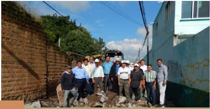
Calle Mariano Matamoros en San Sebastian