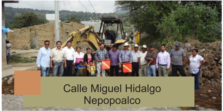
Calle Miguel Hidalgo Nepopoalco