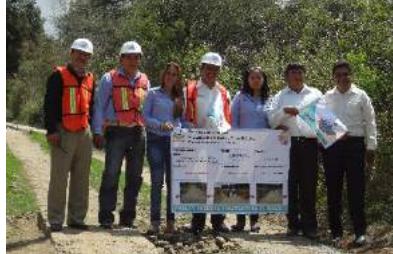
Camino de Saca ejido de Nepopoalco