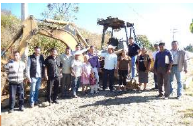
Bacheo Calle Iturbide San Marcos