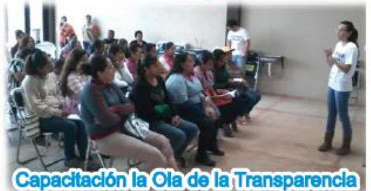
Capacitación la Ola de la Transparencia