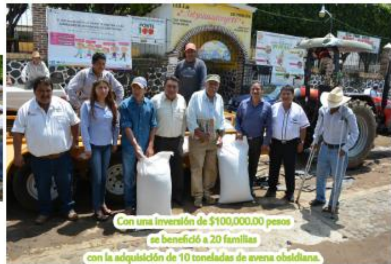
Con una inversión de $100,000.00 pesos se benefició a 20 familias con la adquisición de 10 toneladas de avena obsidiana.