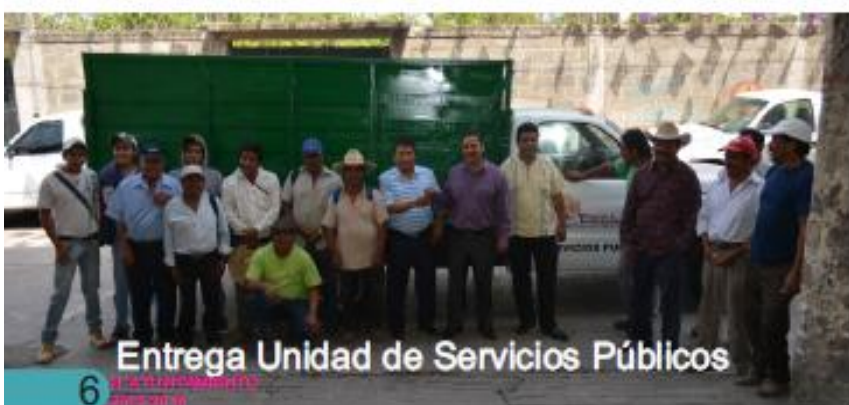
Entrega Unidad de Servicios Públicos

En la Sindicatura Municipal se han generado las medidas conducentes para el control de los bienes que integran el patrimonio del ayuntamiento así como la creación de los resguardos necesarios para su aseguramiento.