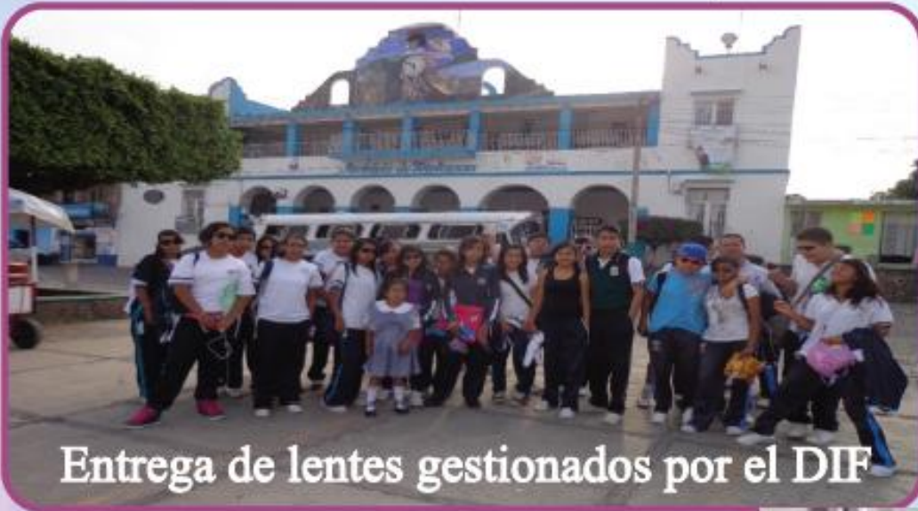
Entrega de lentes gestionados por el DIF