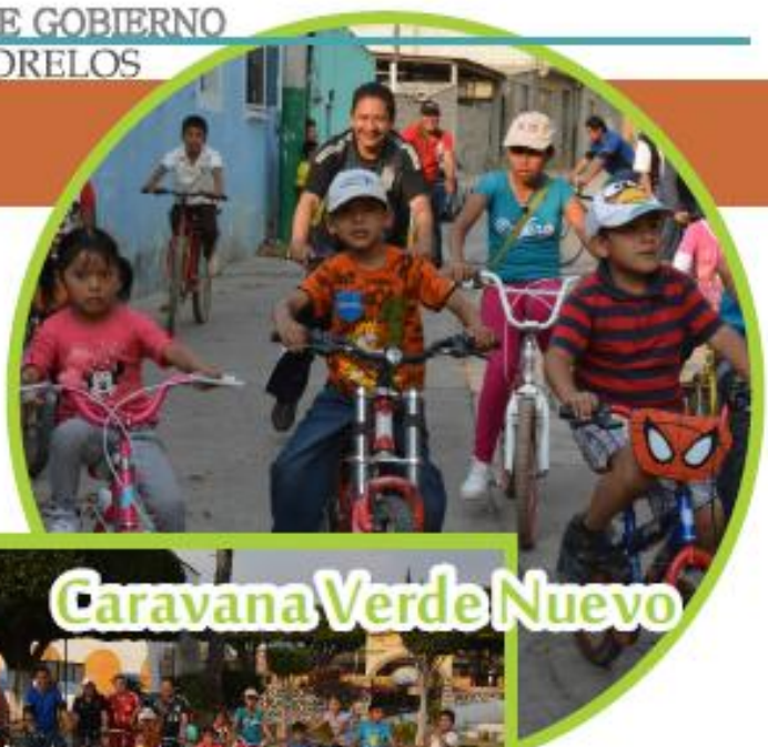
Caravana Verde Nuevo

Por lo anterior mi gobierno ha contribuido a facilitar el acceso uso preservación y disfrute de los bienes y servicios culturales del poblado a través de la difusión y a la creación, se han proporcionado apoyos a la creación artística, vinculando de manera coordinada, la cultura con la educación, la ciencia, la tecnología y el turismo.