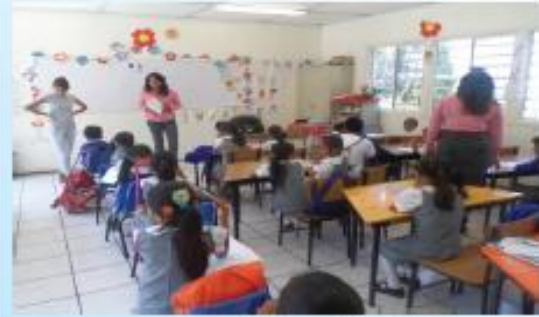
Identificación de maltrato infantil