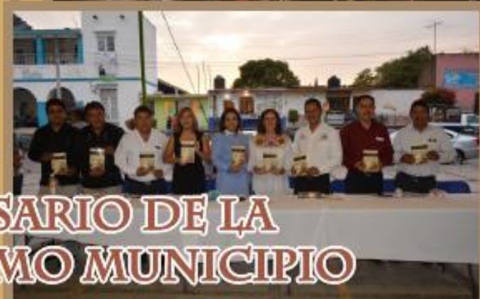
LXXXIV ANIVERSARIO DE LA RATIFICACIÓN COMO MUNICIPIO