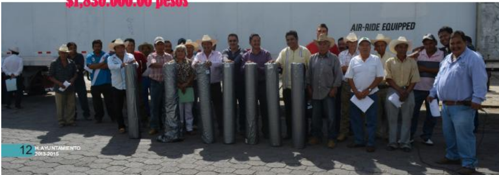
Entrega de Acolchado beneficiando 402 familias con una inversión a través de FAEDE $1,830.000.00 pesos