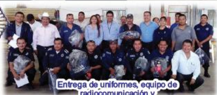
Entrega de uniformes, equipo de radiocomunicación y mantenimiento de patrullas