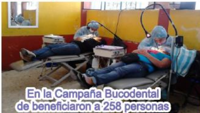
En la Campaña Bucodental de beneficiaron a 258 personas

El DIF municipal ha dado seguimiento a las campañas de salud pública , apoyando a la población en su salud visual, otorgamos 65 pares de lentes a personas de escasos recursos económicos, se realizaron 600 exámenes de la vista, diagnóstico y detección de enfermedades oculares .