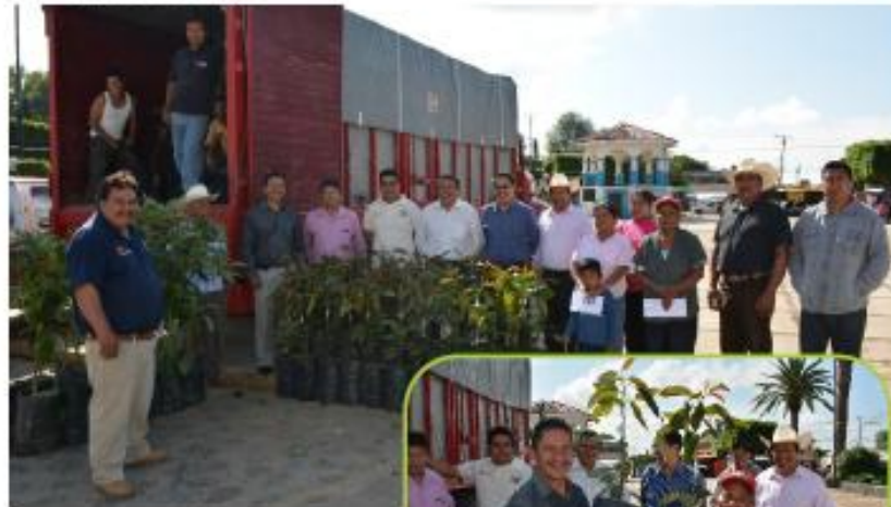
Entregamos 3,000 plantas de aguacate, para el beneficio de las familias de Totolapan

Por concepto de abono orgánico y químico, se beneficiaron a 457 familias , mediante una inversión de $ 2,896,324.00 ( dos millones ochocientos noventa y seis mil trescientos veinticuatro pesos 00/100 m.n.).