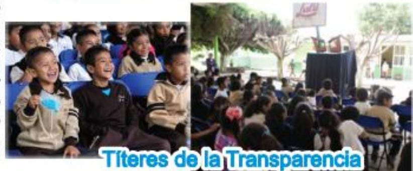
Títeres de la Transparencia