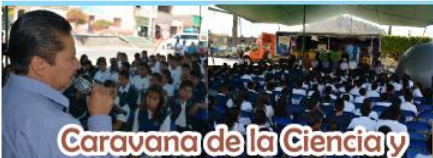
Caravana de la Ciencia y Biblioteca Vagabunda