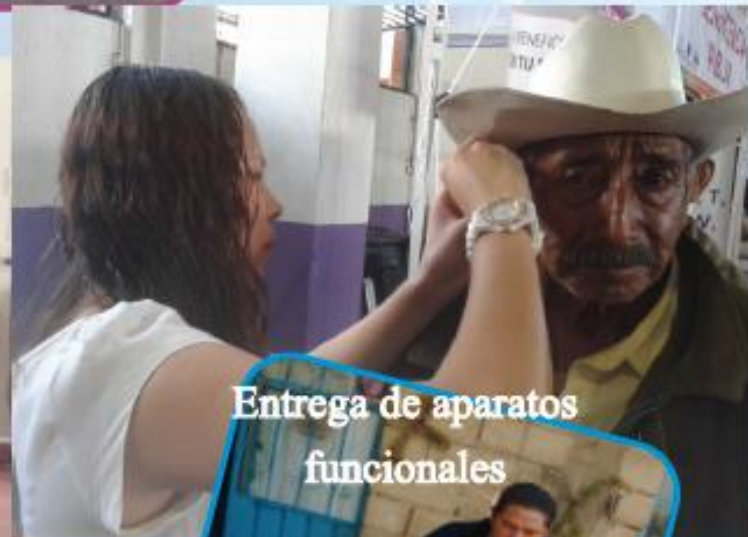
Entrega de aparatos funcionales