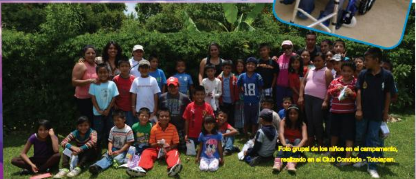
Foto grupal de los niños en el campamento, realizado en el Club Condado - Totolapan.