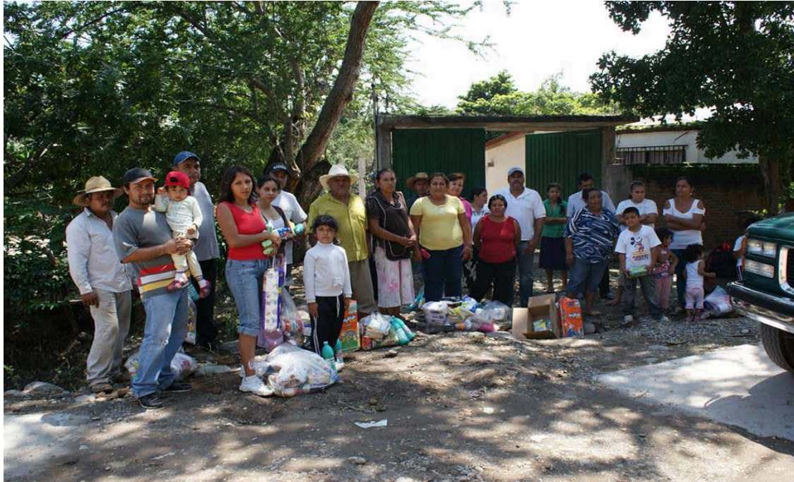
Fotografias de la entrega de viveres Septiembre 2013.