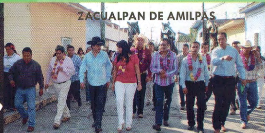
ZACUALPAN DE AMILPAS