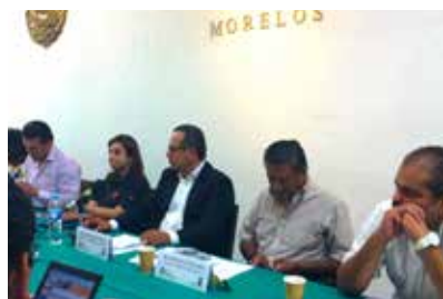
Sesiones de la Comisión de Desarrollo Agropecuario