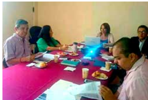
Sesión de la Comisión de Turismo

• Iniciativa con proyecto de decreto por el que se reforma el segundo párrafo del artículo 1 de la Ley de Turismo de Estado de Morelos.