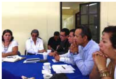
Reunión con el Congreso Agrario Permanente (CAP)