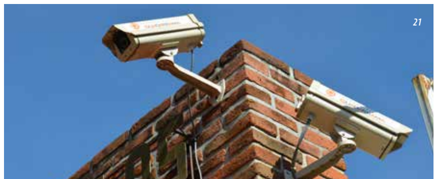
20 y 21) Instalación de cámaras de videoseguridad en la Primaria Primer Centenario, en Yautepec