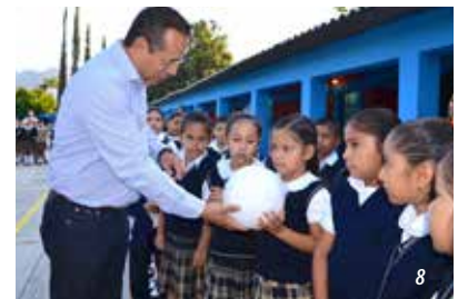
1) Entrega de obsequios, Graduación en Primaria "Niños Héroes de Chapultepec", Col. Huizachera