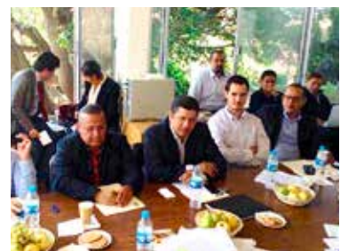
Sesión de la Comisión de Hacienda