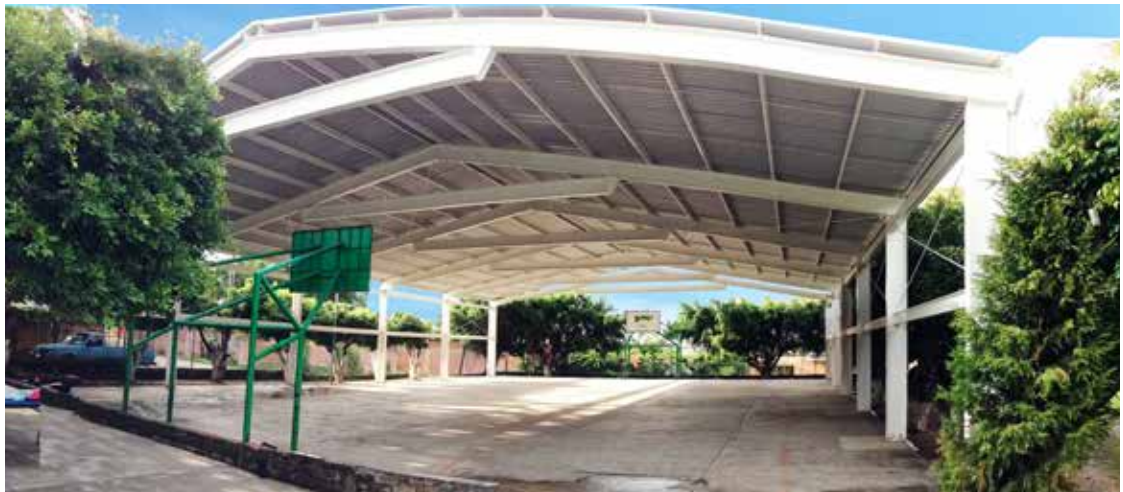
Primaria 16 de Septiembre, Col. El Capulín, poblado de Oaxtepec, Yautepec