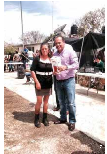
1) Festejo del Día del Niño en la Col. Huizachera, Yauatepec 2) Festejo del Día del Niño en la Col. San Carlos, Yauatepec 3,4,5) Festejo del Día del Niño en la Casa Ciudadana y Gestión