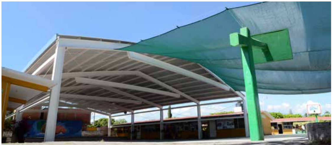
Primaria Cuauhtémoc, Col. Lucio Moreno, poblado de Cocoyoc, Yautepec