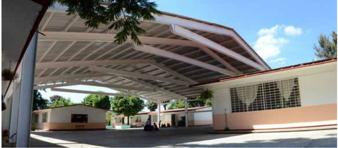
Primaria Miguel Hidalgo, Yautepec

A través de la gestión con Gobierno del Estado se logró la construcción de 3 techumbres.