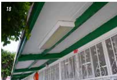
15 a 19) Instalación de lavabos, puertas en baños y donación de pintura e instalación de barandal en la Primaria Rodolfo López de Anda en la Col, Rancho Nuevo