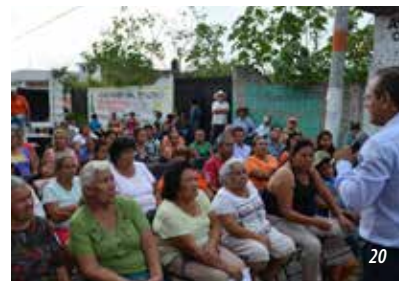
10 y 11) Recorrido Col. Lomas del Potrero 12 y 13) Recorrido Col. Cuauhtémoc, 5 de Mayo, Paraíso y Bonfil 14) Reunión en la Primaria Centenario 15) Reunión con padres de familia en la Primaria 24 de Febrero 16, 17, 18) Recorrido Col. Oacalco 19 y 20) Recorrido Col. Vicente Guerrero