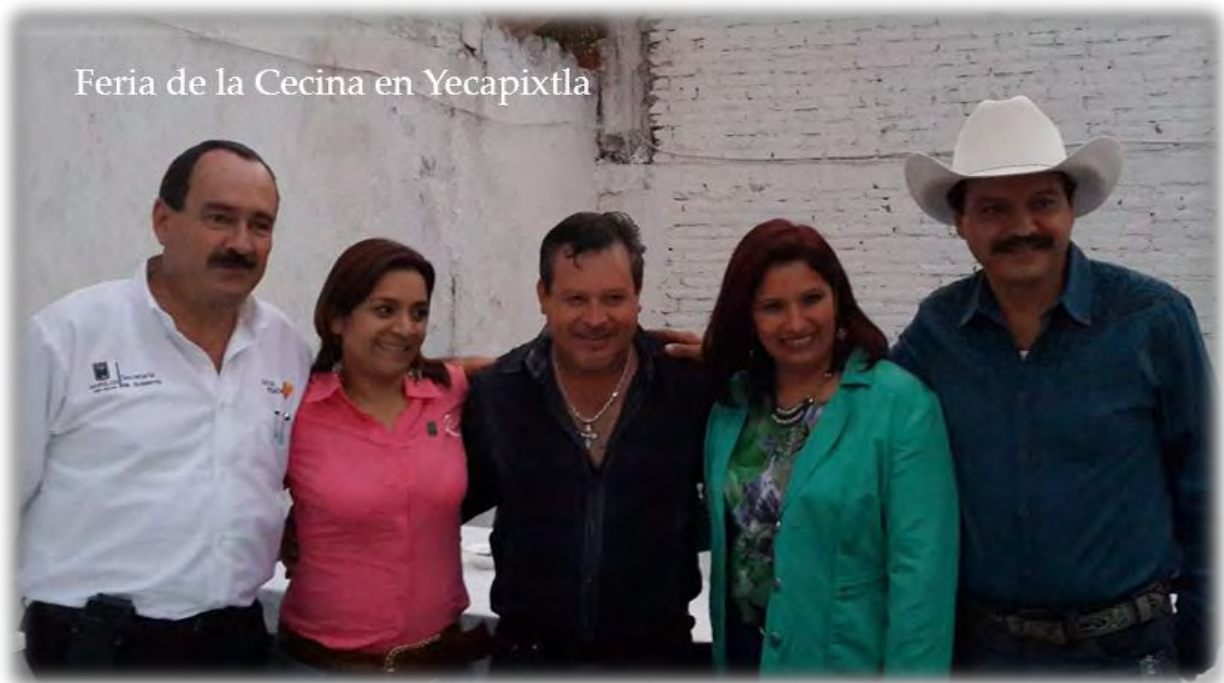
Feria de la Cecina en Yecapixtla