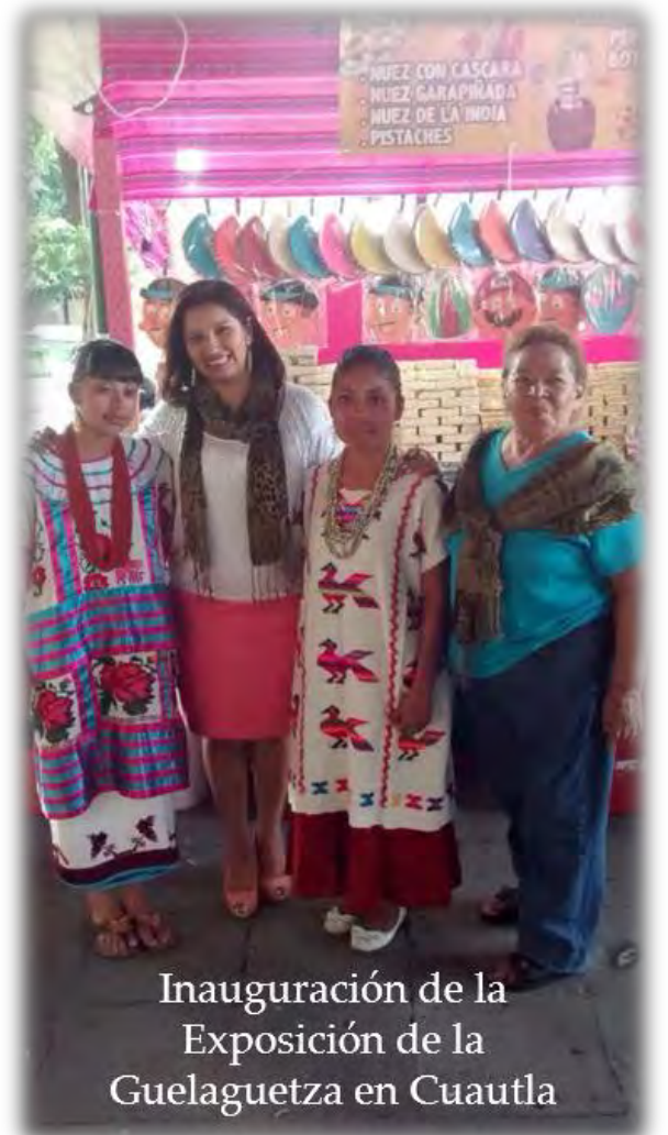
Inauguración de la Exposición de la Guelaguetza en Cuautla