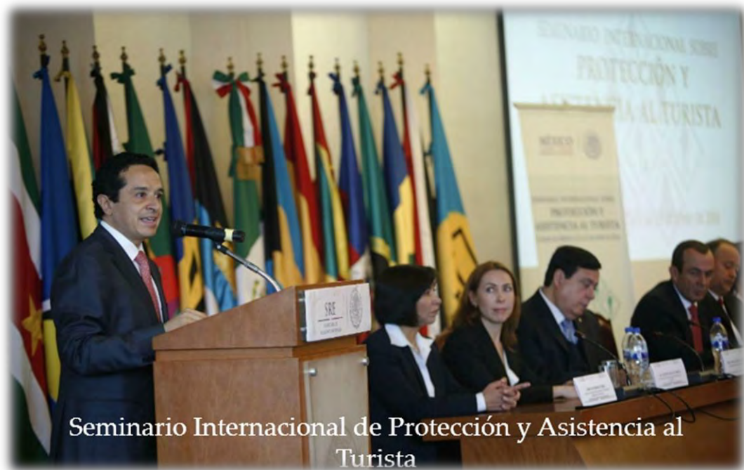
Seminario Internacional de Protección y Asistencia al Turista