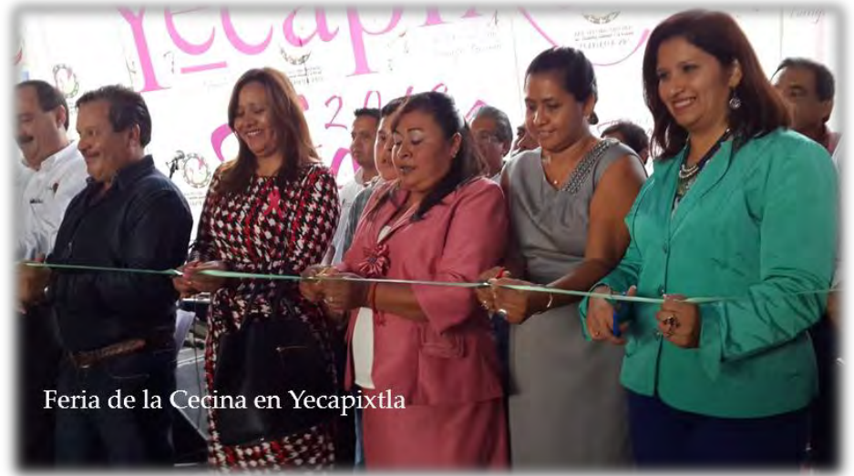
Feria de la Cecina en Yecapixtla