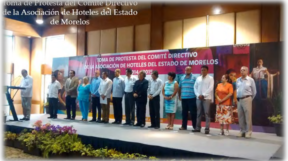
Toma de Protesta del Comité Directivo de la Asociación de Hoteles del Estado de Morelos