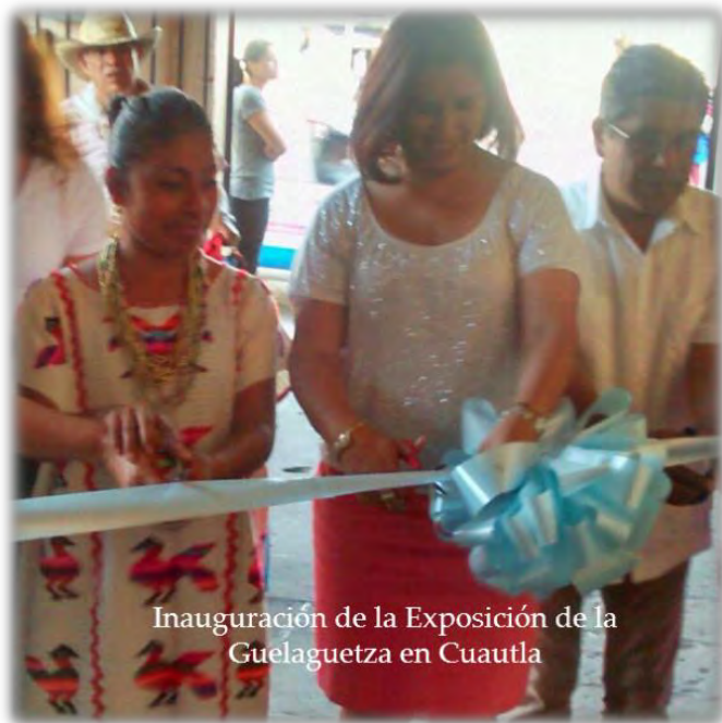
Inauguración de la Exposición de la Guelaguetza en Cuautla