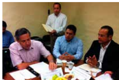
Sesiones de la Comisión de Desarrollo Agropecuario