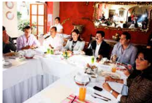
Sesión de la Comisión de Turismo

• Dictamen de las observaciones al Decreto número cuatrocientos noventa y dos, por el que se adiciona el capítulo II del Turismo de naturaleza al Título tercero, recorriéndose la numeración de los artículos subsecuentes, así como la numeración de los Capítulos siguientes.