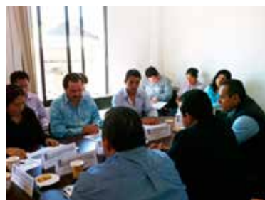
Sesión de la Comisión de Hacienda