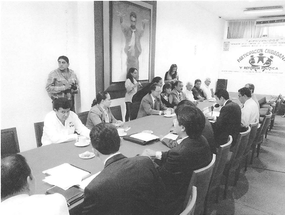
En sesión de la Comisión con diversos grupos Ciudadanos

2012 y turnada a esta Comisión con fecha dos de Octubre en donde el Ciudadano exgobernador Dr. Marco Antonio Adame Castillo, realiza observaciones al decreto número dos mil ciento veinticinco por el que se reforma el artículo 19 bis de la Constitución Política del Estado Libre y Soberano del Estado de Morelos, sobre el cuál se han estado realizando diversas reuniones con los integrantes de la Comisión y con la Comisión de Puntos Constitucionales para lograr los acuerdos necesarios y darle continuidad al proceso legislativo, siendo un punto que se encuentra pendiente y que se concluirá durante el periodo febrero-julio del 2013.