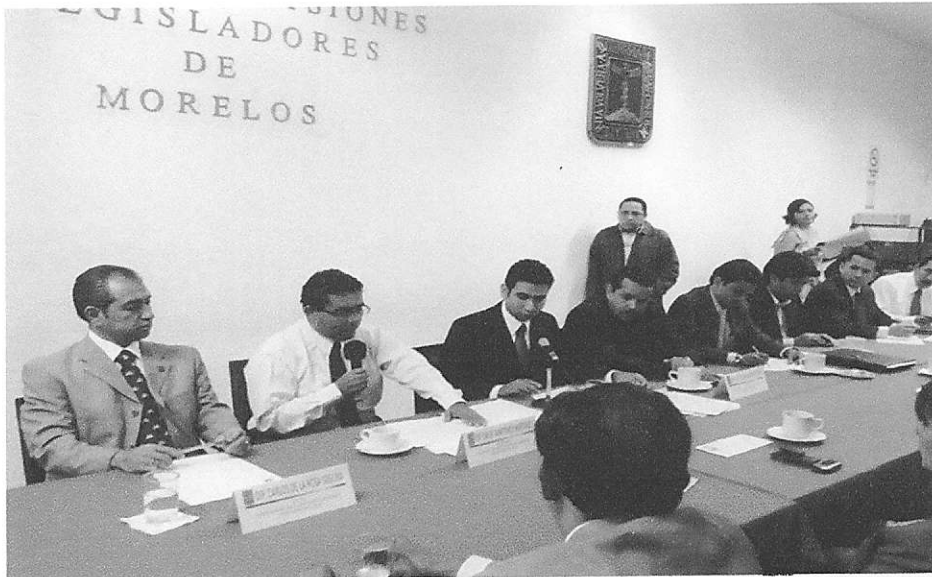
En sesión de la Comisión

Se presentó a los nuevos integrantes el Plan de Trabajo de la Comisión de Participación Ciudadana y Reforma Política para su estudio y modificación, siendo éste aceptado en todas sus partes y así fue presentado a la Presidencia de la Mesa Directiva y a la Presidencia de la Junta Política de acuerdo a lo establecido en la Ley Orgánica y el Reglamento ambos para el Congreso del Estado.