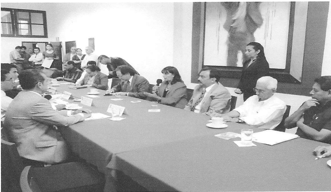
Escuchando a representantes de Organismos descentralizados y representantes de la Universidad del Estado de Morelos